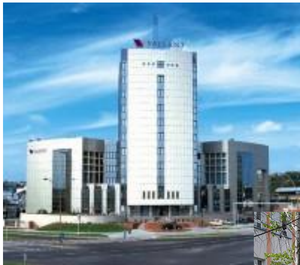
ICN Polfa Rzeszów S.A.