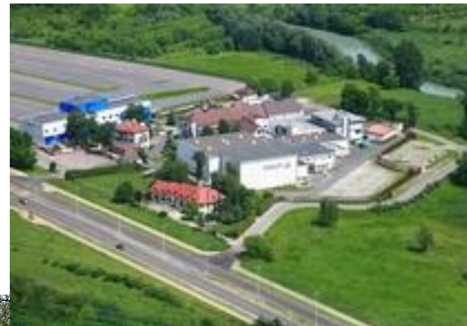
Sanofi-Aventis Sp. z o.o.